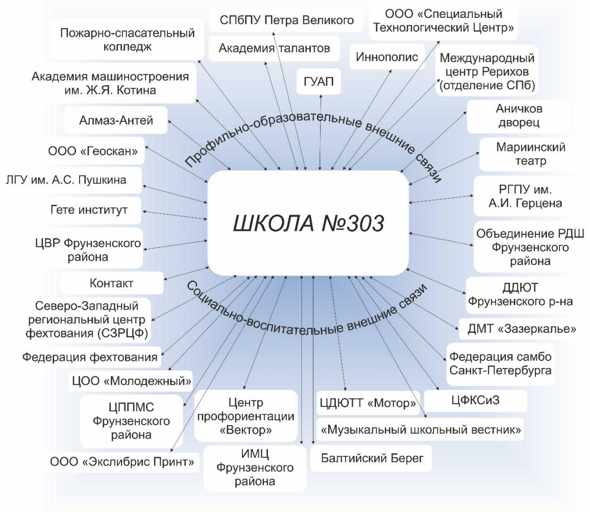
Схема «Система социального партнерства и сетевого взаимодействия в ГБОУ СОШ №303»